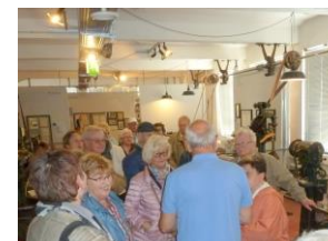
Besuch Deutsches Schuhmuseum in Hauenstein.