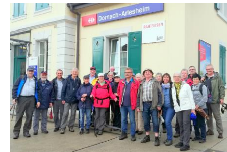
Wanderung mit Senioren der Partnergemeinde Steinmaur.