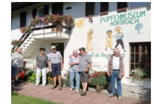
Besuch Puppen- und Spielzeugmuseum in Nordrach.